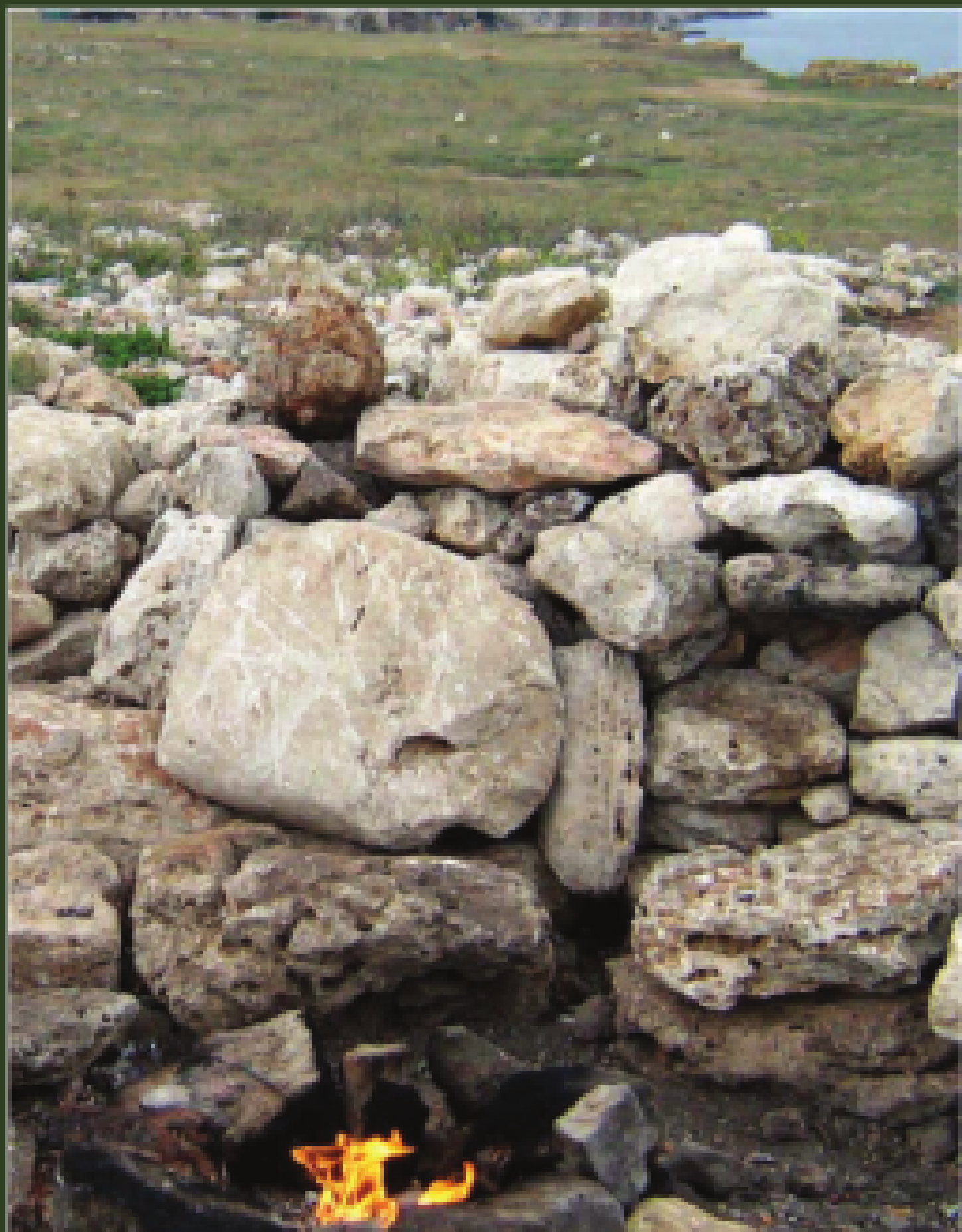
Вечният огън край Каварна